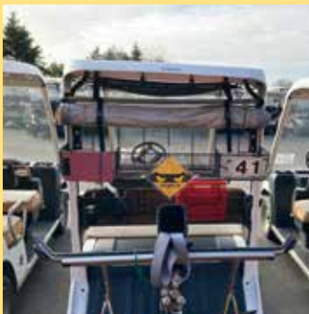
ゴルフ場カートに