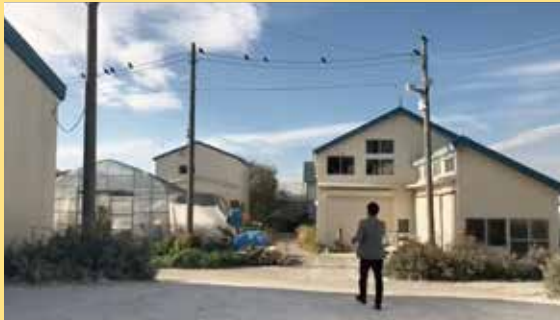
ガラスに見せる前