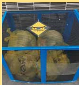
ゴミステーションに