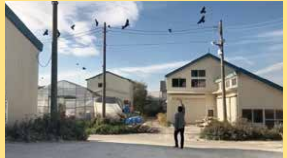
ガラスに見せた後